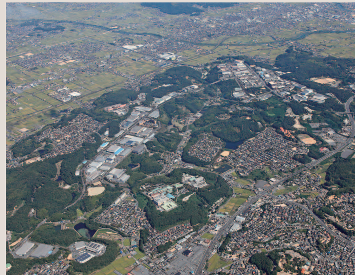
早島上空から流通センターをのぞむ