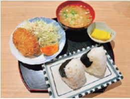
れんこんコロッケ定食

当組合は、町内で生産された野菜や果物をはじめ、地域資源を活かした加工品や特産品の販売を行っています。また、地元食材を使用したれんこんコロッケ定食やたまごかけご飯などの提供も行っており、お客さまが気軽に立ち寄り、ゆっくりと過ごせる場づくりに努めています。生産者の想いや背景が伝わる商品やサービスを通じて、安心して利用していただける施設運営を心がけるとともに、イベントの開催や情報発信を通じて、交流人口の拡大や地域のにぎわい創出にも取り組んでいます。