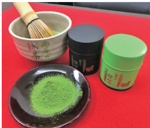
伝統的な製法で高い評価を得る「西尾の抹茶」

地域ブランド取得と国内外への積極的なプロモーションに成功したことで「西尾の抹茶」の知名度は確実に向上しました。加えて、工場見学や抹茶カフェ等の新店が増えたことで西尾市への観光客数が増え、1.46倍増加し、地域活性化にも貢献しています。今後も抹茶の生産量維持と更なる需要拡大を目標に、組合事業に取り組んでいきます。