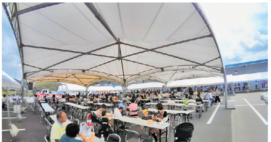
家族・親戚等を招待して開催するファミリー祭

福利厚生を通して会社に大切にされている環境に感謝しています。子供が手を離れたときには、より一層会社に貢献していきたいです。