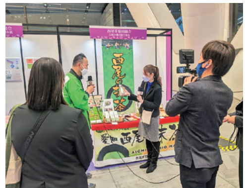
「組合まつりinTOKYO」で取材を受ける様子

他産地に負けないブランド構築を目指し「西尾の抹茶」を国内外に積極的にプロモーション。行政や異業種との連携が鍵となり、知名度アップと販路拡大、西尾市の地域活性化を実現した。