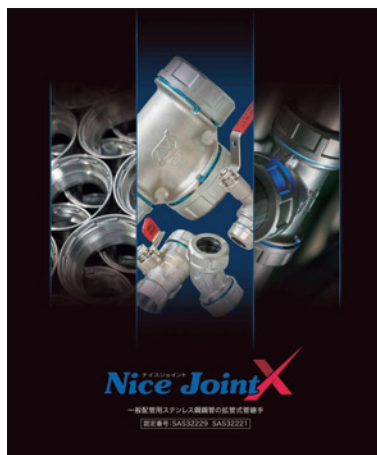
揺れに強く、簡単施工で誰にでも扱える継手「ナイスジョイントX」