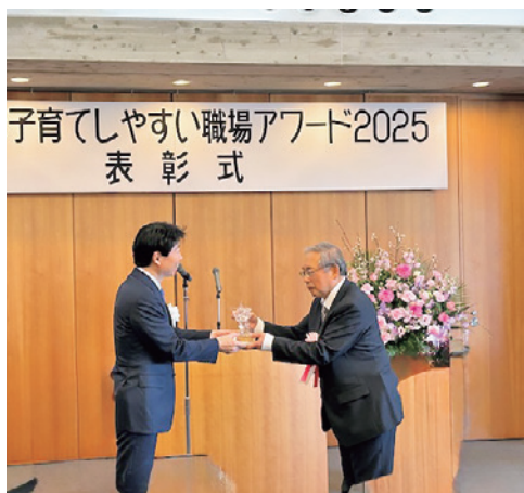
おかやま子育てしやすい職場アワード2025 表彰式

また、出産祝い金10万円に加え、小学校から大学・専門学校まで各段階での「入学祝い金」の支給も行っています。教育費の負担が増す時期に、会社として少しでも寄り添いたいという思いの現れです。従業員が安心して家族を支え、