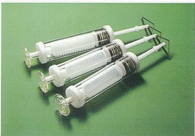
玉野市のBOXカルバート取合いもたれ擁壁に、クラック樹脂注入。